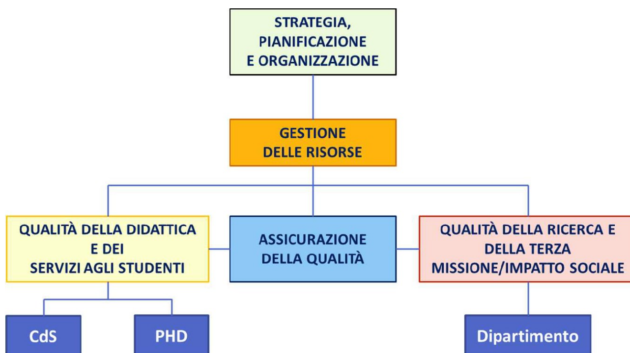
Fig. 1 – La struttura del Modello AVA 3

gestione delle risorse (Ambito B), intese come risorse umane (personale docente e di ricerca e tecnico-amministrativo), finanziarie, strutturali (in termini di strutture nonché di attrezzature e tecnologie), infrastrutturali e di gestione delle informazioni e della conoscenza; l'Ambito C approfondisce i processi di Assicurazione della Qualità (Ambito C) a livello di Ateneo; gli ultimi due ambiti sono dedicati alla pianificazione e gestione dei processi di pianificazione e gestione della didattica e dei servizi agli Studenti (Ambito D) e di quelli della ricerca e della terza missione/impatto sociale (Ambito E) sviluppati a livello di Ateneo» (Linee guida per il sistema di AQ, ANVUR).